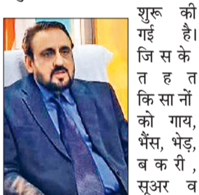
पशुधन किसान क्रेडिट कार्ड योजना की जानकारी देते हुए उपायुक्त

हरियाणा सरकार द्वारा किसानों के लिए पशुओं के रखरखाव के लिए पशुधन किसान क्रेडिट कार्ड योजना