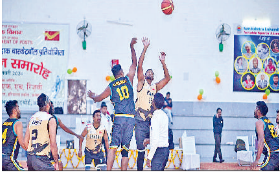
कुरुक्षेत्र। बास्केटबॉल प्रतियोगिता में प्रतिभागीता करते प्रतिभागी।