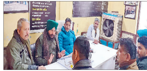
कुरुक्षेत्र। मांगों बारे विचार विमर्श करते यूनियन के पदाधिकारी। 9केयूके05

ऑल हरियाणा रोडवेज वर्कर्स यूनियन रजिस्टर नंबर 1947 की कौर कमेटी की बैठक कुरुक्षेत्र कार्यालय में संपन्न हुई। बैठक में महाप्रबंधक को पूर्व में दिए हुए मांग पत्र पर विचार में विमर्श किया गया और सर्वसम्मति से यह निर्णय लिया गया कि इन मुद्दों को लेकर 12 जनवरी 2024 को पिहोवा सब डिपो यूनियन कार्यालय में 11 बजे कार्यकर्ता की मीटिंग बुलाकर आगामी फैसला लिया जाएगा। इसमें मुख्य रूप से कौशल रोजगार योजना के तहत लगे कर्मचारी का वेतन समय पर