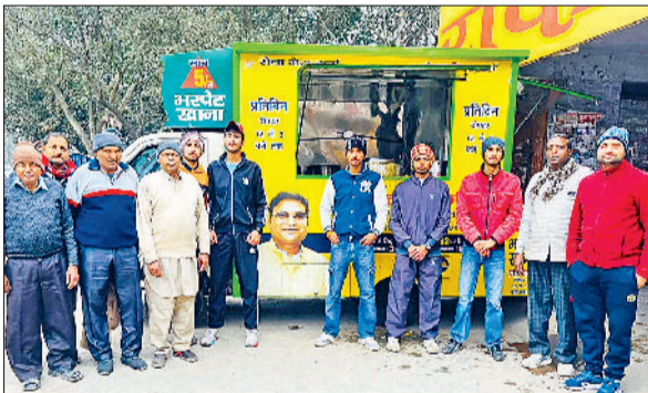
यमुनानगर। रादौर में बनी रसोई में सेवाएं प्रदान करने पहुंचे ब्राइट फ्यूचर अकादमी के सदस्य।